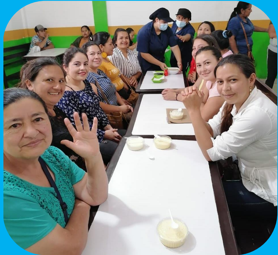
Coordinadoras de grupos veredales

La afectación en las economías de los países desde los más ricos hasta los más pobres, tardarán mucho tiempo en recuperarse y es justamente en este punto en el que queremos hacer gran énfasis, ya que mientras los comercios e industrias despedían personal, la Corporación Oficio & Arte –a pesar de su reciente constitución– ha logrado impactar positivamente a más de 50 Familias en varias regiones del territorio colombiano, generándoles parte de su mínimo vital.